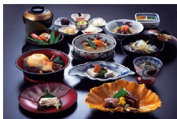
懇親会では豪華懐石料理を堪能