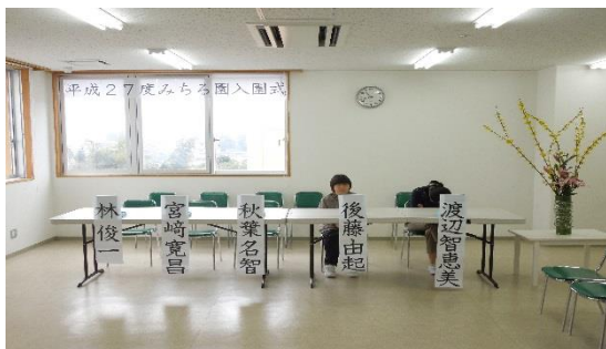
厳粛な式典会場（新館特設ホール）

平成27年4月1日うらかな小春日和、当園の入園式が厳粛に執り行われました。式典の出席者は新入園者5名を含め総勢70名を超え近年で最も盛大な式典となりました。