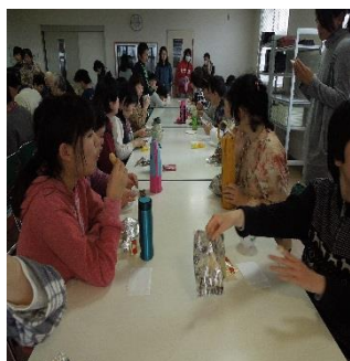
土曜開所も楽しみです

今年の4月より始まった新しい事業で、現在8名の利用者さんが活動しています。主な活動は、クリーニング屋から頂いた洗濯たみと各種販売参加、喫茶の運営を行っています。皆さん初めての活動が多いため、毎日楽しく活動に取り組まれています。